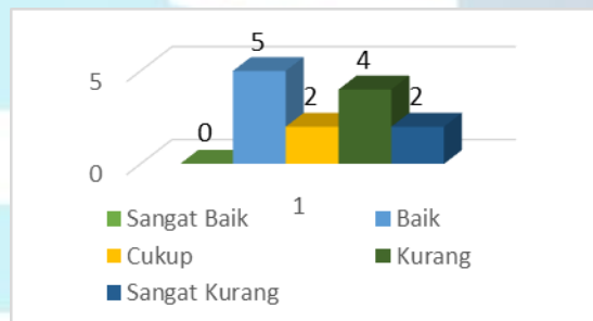
Gambar 2 Diagram Hasil Penelitian Tes Passing Tim Putra UKM bola basket Universitas Nusantara PGRI Kediri

Apabila hasil penelitian tes passing tim putra UKM bola basket Universitas Nusantara PGRI Kediri ditampilkan dalam bentuk diagram dapat dilihat pada gambar di bawah ini: