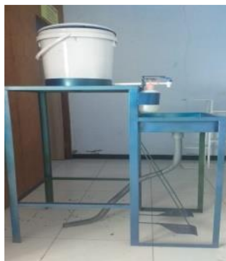
Gambar 4 Tampak Samping