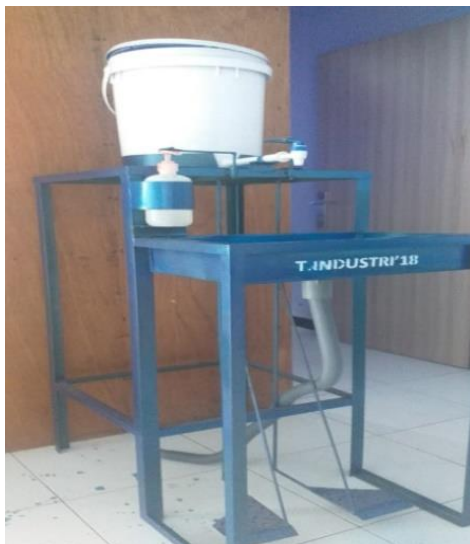
Gambar 5 Tampak Samping