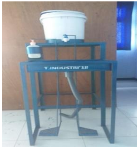
Gambar 3 Tampak Depan

Tempat cuci tangan portable ini selanjutnya akan dilakukan percobaan sejauh mana kapasitas tempat air dan kelancaran dalam proses penekanan sehingga air dan sabun bisa mengalir secara maksimal tanpa ada sumbatan.