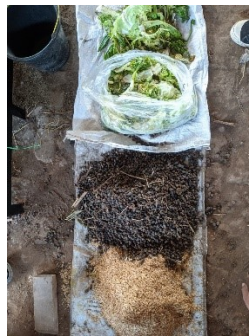
Gambar 7. Sebelum Proses Pengadukan Pada Percobaan Kedua