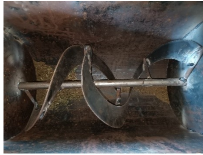
Gambar 4. Tabung dan Pisau Pengaduk