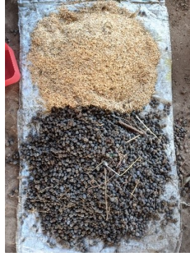
Gambar 5. Sebelum Proses Pengadukan Pada Percobaan Pertama