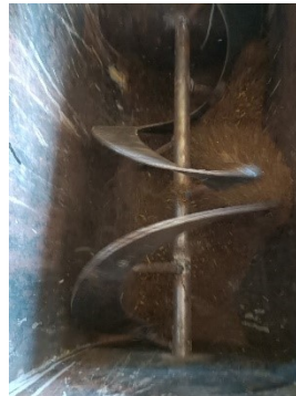
Gambar 6. Setelah Proses Pengadukan Pada Percobaan Pertama