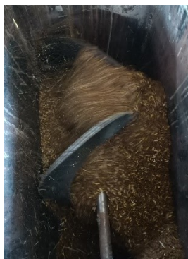
Gambar 8. Setelah Proses Pengadukan Pada Percobaan Kedua