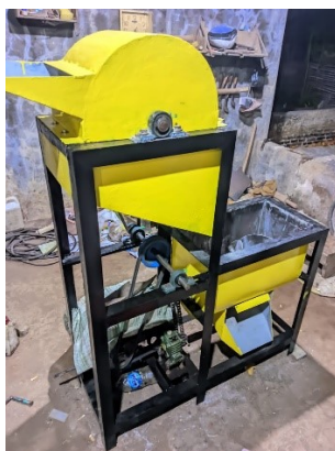
Gambar 3. Mesin Pengolah Kompos

Mesin pengaduk kompos ini menggunakan pengaduk dengan jenis type helical ribbon dengan bahan tabungnya menggunakan plat besi dengan tebal 1mm dan berdimensi 546mm x 300mm x 352mm serta memiliki poros pengaduk yang panjangnya 700mm dengan hook pengaduk berjumlah 4 biji dibuat melingkar dengan ketebalan 30mm yang mempunyai bahan plat besi strip dan memiliki kapasitas 5kg/menit. Berikut ini desain mesin pengolah kompos dan alat pengaduknya :