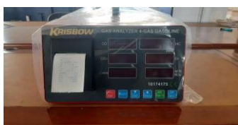
Gambar 1. Gas Analyzer

instrumen atau alat yang digunakan untuk mengukur proporsi dan komposisi dari gabungan gas