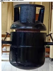
Gambar 5. Tungku luar

Tungku luar pada mesin pelebur limbah kaca kapasitas 5 liter ini dibuat dari bahan semen dengan ketebalan 5 cm dan dilapisi tabung LPG bekas 12 kg dengan ketebalan bahan 2 mm yang mempunyai ukuran tinggi 430 mm dan diameter 940 mm.