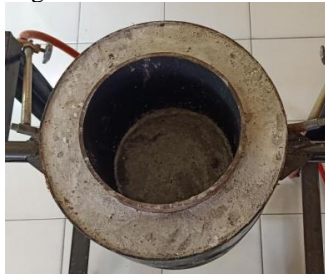
Gambar 4. Tungku dalam

Tungku Dalam pada mesin pelebur limbah kaca kapasitas 5 liter ini berbentuk tabung dengan tinggi 250 mm dan diameter 600 mm, yang dibuat dari bahan pipa besi dengan ketebalan 1 cm. Dengan tinggi serta diameter yang sudah ada, maka volume tungku dalam adalah sebagai berikut :