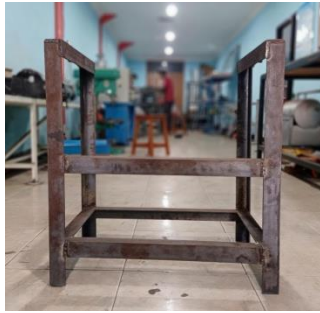
Gambar 3. Kerangka mesin