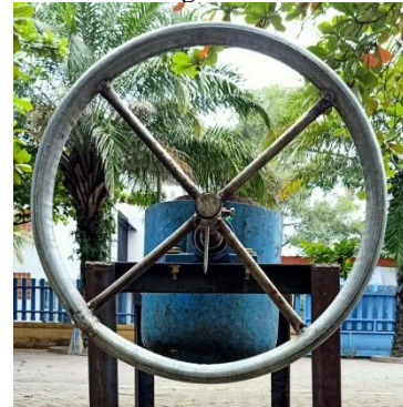
Gambar 6. Roda pemebalik tabung

Roda Pembalik tabung pada mesin pelebur limbah kaca kapasitas 5 liter ini dibuat dari bahan pipa besi 30 mm yang mempunyai ukuran Roda diameter 1450 mm.