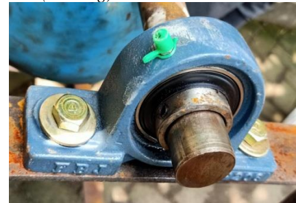
Gambar 7. Bantalan ( Bearing )

Bantalan ( Bearing ) berfungsi Untuk menjaga menjaga poros (shaft) agar roda pemebalik tabung selalu berputar terhadap sumbu porosnya pada mesin pelebur limbah kaca kapsitas 5 liter Berikut adalah gambar dari bantalan ( Bearing ) [5].