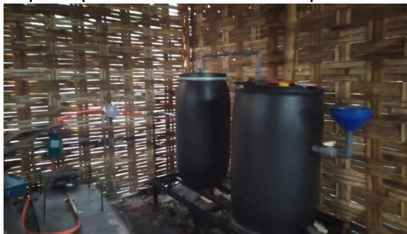
Gambar 4. Biodigester

Biodigester yang dibuat adalah biodigester yang tidak permanen ( portable ) yang dapat dipindah sesuai saran dari pemilik home industry tahu seperti Gambar 4.