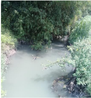
Gambar 1. Sungai yang terkena limbah cair tahu

tahun menghasilkan dan emisi sekitar 1 juta ton CO 2 ekuivalen pertahun. Jumlah limbah cair tahu dari 1 kg kedelai setiap proses adalah rata-rata sebesar 43,5 liter dengan kandungan protein, lemak, karbohidrat, vitamin, asam organik, asam amino, isoflavon, saponin, P, Ca, Fe dan nutrisi lain (Nurhasan dan Pramudyanto, 1987; Barbosa dkk., 2006; Tang dan Ma, 2009 dalam Widayat, 2015). Air sungai yang tercemar oleh limbah cair tahu berwarna putih dan keruh seperti pada Gambar 1.