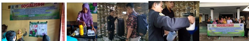
Gambar 5. Kegiatan penjelasan materi, demonstrasi membuat starter, demonstrasi biodigester, demonstrasi biogas

Kegiatan demonstrasi pembuatan biogas dilakukan setelah tim peneliti melakukan sosialisasi yang meliputi ceramah tentang limbah, bahaya limbah dan cara memanfaatkan limbah. Selanjutnya tim peneliti mendemonstrasikan cara membuat starter, mendemokan biogas dan terakhir mendemokan cara membuat biogas. Masing-masing kegiatan dapat dilihat pada Gambar 5.